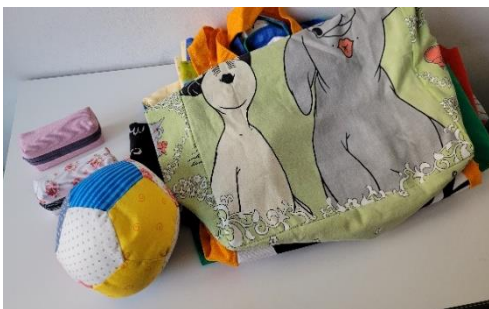
Neue Gebrauchsartikel gefertigt aus alten Stoffen.