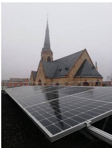
Blick vom neuen PV-Dach auf die Johanneskirche

Das Flachdach des Neubaus in der Eberbacher Straße, der ab September rund 100 Kita-Kinder empfängt und auch als Gemeindehaus der Gemeinde Feudenheim fungiert, wurde kürz-