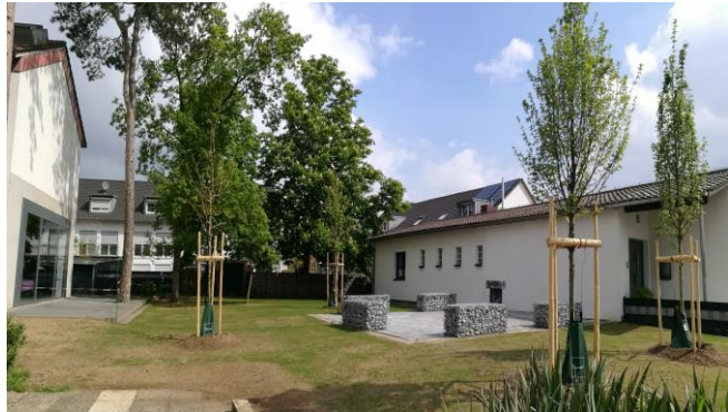
Außengelände der Martinskirche vor und nach den Begrünungsmaßnahmen.