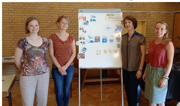
Referentinnen und Organisatorinnen des GeLeNa-Kochworkshops

Finanziert wurde die Veranstaltung mittels des Preisgeldes, welches wir für unser Kita-Projekt GeLeNa beim Nachhaltigkeitspreis der Evangelischen Bank 2021 gewonnen haben.