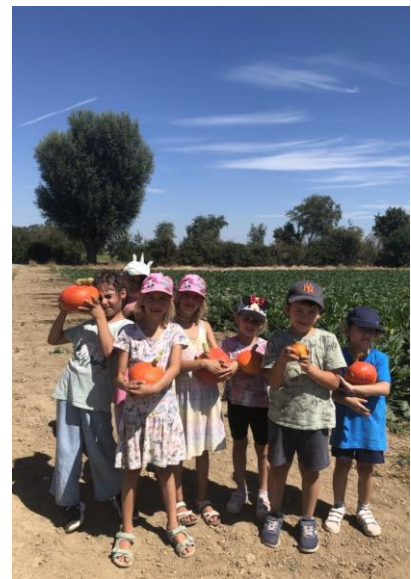
Vorschulkinder aus der Kita Käfertalerstraße entdecken das Hofgut Petersau.