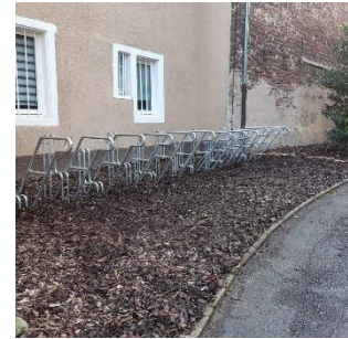
Neuer Fahrradständerpark an der Erlöserkirche

Bis vor Kurzem gab es an der Erlöserkirche keine Möglichkeit, Fahrräder sicher und bequem abzustellen. Räder wurden deshalb an die Kirchenmauer gelehnt oder einfach entlang der Kirchenmauer am Fahrweg geparkt. Mit finanzieller Unterstützung aus dem internen EKMA-Klimaschutzfonds konnten nun 2 Ständer für je 6 Räder an der Kirche installiert werden. Sie ermöglichen das diebstalsichere Abschließen der Räder und bieten somit einen weiteren Anreiz, klimafreundlich mit dem Rad zur Kirche zu kommen.