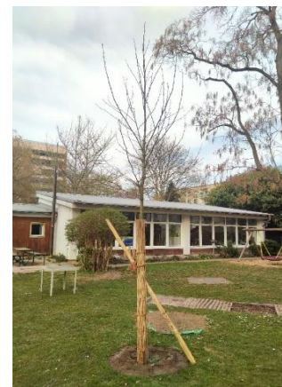
Baumpflanzaktion auf der Melanchthonwiese.

Finanziell gefördert wurde die Baumpflanzaktion im Rahmen der Grüner Gockel Förderung und durch den internen EKMA-Klimaschutzfonds.