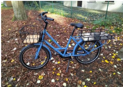
Neues Lastenrad der Neckarstadt-Gemeinde

Ein neues Lastenrad in der Neckarstadtgemeinde hilft fortan, innerstädtische Dienstgänge möglichst klimafreundlich durchzuführen. Das Gemeinderad wird v.a. für Transporte zwischen der Gemeinde und dem Sitz der Kirchenverwaltung in M1 eingesetzt. Mit einem Ladevermögen von 200 Kilogramm soll es auch genutzt werden, um Transporte innerhalb der recht weitläufigen Gemeinde schnell und klimafreundlich zu bewältigen.