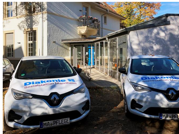
Zwei neue Dienstwagen der Diakonie-Sozialstation fahren rein elektrisch.

Der Anfang wurde im Oktober mit dem Erwerb von zwei E-Fahrzeugen gemacht. Zuschüsse des Bundes und aus dem Klimaschutzfonds der EKMA halfen finanziell, um den Kauf der neuen Dienstwagen zu ermöglichen. Da die Diakonie-Station seit Juli 2021 Ökostrom aus 100% erneuerbaren Energiequellen bezieht, sind die neuen Fahrzeuge mit „grünem Strom“ klimafreundlich unterwegs.