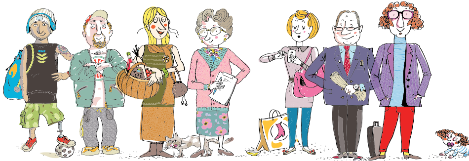
Illustration: Uwe Meyer