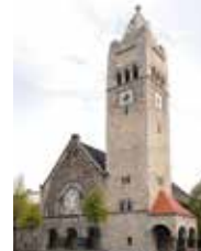
Johanniskirche Windeckstr. 1 68163 Mannheim-Lindenhof

Öffentliche Verkehrsmittel: Haltestelle Marktplatz | Straßenbahnlinien: 1, 3, 4, 5, 7