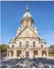
Christuskirche Werderplatz 17 68161 Mannheim-Oststadt

Öffentliche Verkehrsmittel: Haltestelle Rosengarten | Straßenbahnlinien: 2, 5 Haltestelle Wasserturm | 2, 3, 4, 6,