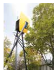
Melanchthonkirche Lange Rötterstr. 39 68167 Mannheim Neckarstadt

Öffentliche Verkehrsmittel: Haltestelle Fürstenwalder Weg | Bus RNV 54 Haltestelle Potsdamer Weg | Straßenbahnlinie: 7