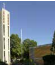
Epiphaniaskirche Andreas-Hofer-Straße 39, 68259 Mannheim-Feudenheim

Öffentliche Verkehrsmittel: Haltestelle Windeckstraße | Straßenbahnlinie: 3