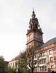
CityKirche Konkordien R 2,1 68161 Mannheim-Innenstadt

Öffentliche Verkehrsmittel: Bahnhof Friedrichsfeld Südbahnhof