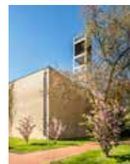
Paul-Gerhardt-Kirche Paul-Gerhardt-Straße 2 68169 Mannheim Neckarstadt

Öffentliche Verkehrsmittel: Haltestelle Rathaus | Straßenbahnlinie: 5