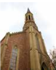
Erlöserkirche Seckenheimer Hauptstr. 135 68239 Mannheim-Seckenheim

Öffentliche Verkehrsmittel: Haltestelle Alter Messplatz | Straßenbahnlinien: 1, 2, 3, 4 Haltestelle Lange Rötterstraße | Straßenbahnlinien: 4, 5