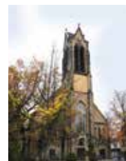
Matthäuskirche Rheingoldstraße 30 68199 Mannheim-Neckarau

Öffentliche Verkehrsmittel: Haltestelle Ziethenstraße | Straßenbahnlinie: 7 Haltestelle Liebfrauenstraße | Straßenbahnlinie: 2