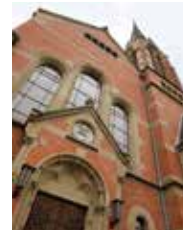
Johannes-Calvin-Kirche Wallonenstr. 18 68229 Mannheim-Friedrichsfeld

Öffentliche Verkehrsmittel: Haltestelle Rosengarten | Straßenbahnlinien: 2, 5 Haltestelle Wasserturm | 2, 3, 4, 6,