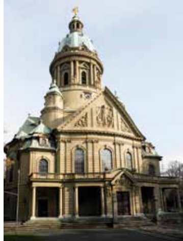
Kantorat an der Christuskirche Bezirkskantorat Mannheim Landeskantorat Nordbaden Werderplatz 16 | 68161 Mannheim

Bachchor Mannheim montags 19.30 - 21.30 Uhr